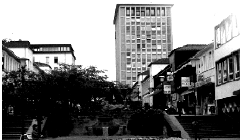
(Treppenstraße Blick in Richtung Kulturbahnhof)

Unsere Idee, die 50er Jahre in Kassel in den Mittelpunkt der Bewerbung zur Kulturhauptstadtbewerbung 2010 zu stellen, soll durch folgende Idee ergänzt werden: