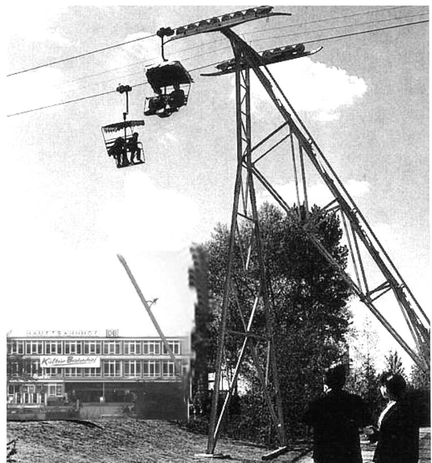
(Start der Seilbahn am Kulturbahnhof)